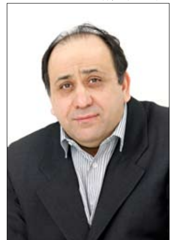
Kurdikirjailija Khasro Pirbal (kuvasa) myötäilee autonomisen Kurdistanin presidentin Massud Barzani näkemystä, jonka mukaan Kurdistan ei halua olla osa kurdiongelmaa vaan osa sen ratkaisua.

Irakissa asuvat kurdit ovat olleet pettyneitä siihen, ettei Yhdysvallat, jolla on edelleen noin 50 000 miestä Irakissa, ole puuttunut mitenkään tuoreisiin levottomuuksiin. He ovat varmoja siitä, että Turkki oli ilmoittanut Irakiin ulottuvista toimitaan etukäteen Yhdysvalloille.