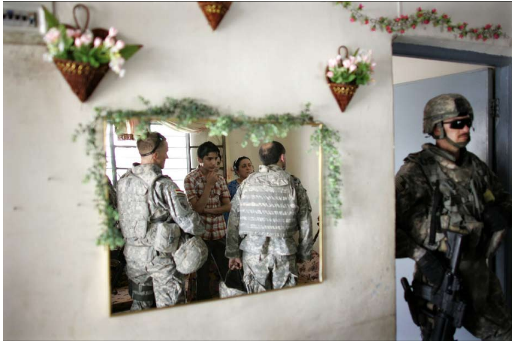
Yksityiskodeista aseita ja räjähteitä etsivä amerikkalaispartio kuulustelee mosulilaista perhettä.

– Meillä kaivataan kaikenlaisia investointeja. Otamme ulkomaalaiset sijoittajat riemu-